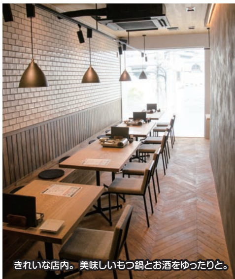
きれいな店内。美味しいもつ鍋とお酒をゆったりと。