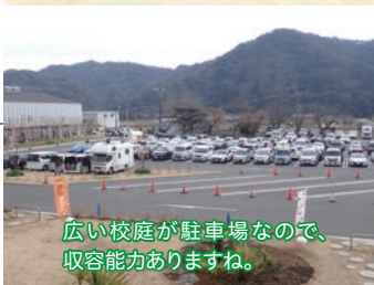
広い校庭が駐車場なので、収容能力ありますね。

まさか道の駅とはいかないでしょうが、この町にあった有効な転身を期待したいですね。