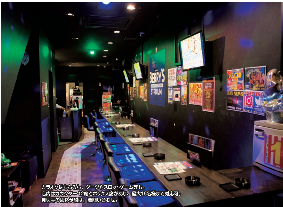
カラオケはもちろん、ダーツやスロットゲーム等も。 店内はカウンター12席とボックス席があり、最大16名様まで対応可。 貸切等の団体予約は、要問い合わせ。