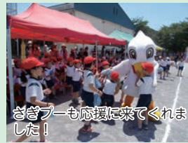
さきプーも応援に来てくれました！