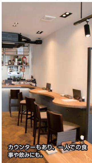
カウンターもあり、一人での食事や飲みにも。