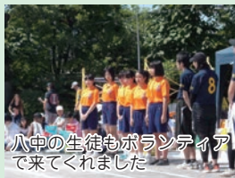
八中の生徒もボランティアで来てくれました

たところ、「簡易タイプではあるけれど10張りはありますよ。」とのお返事をいただき、一気にテントによる暑さ