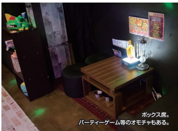
ボックス席。 パーティーゲーム等のオモチャもある。