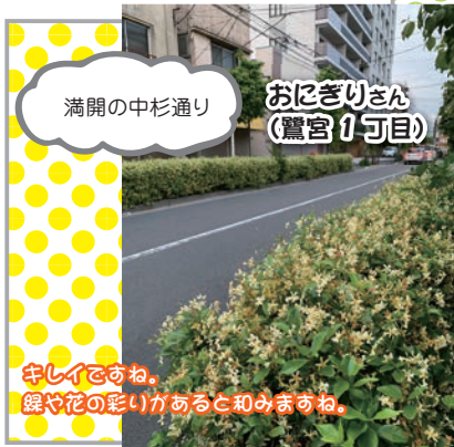
おぼきりさん (鷺宮1丁目)