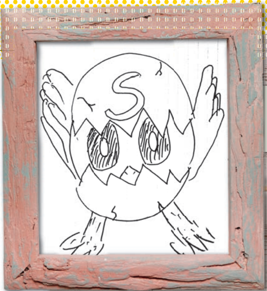
「サギピー」 そめ太郎