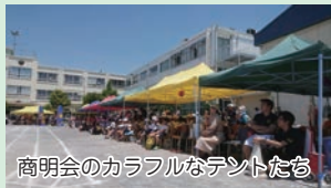
商明会のカラフルなテントたち

テントは、オリンピックのマークを思わせるような色合いで、とても評判がよかったです。たくさんお借りできたおかげで、児童席だけでなく保護者席にもところどころ並べることができ、直射日光を避けるスペースを作ることができました。昨年度PTAから