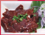
東京現代屋台 「青森シャモロックのレバ刺し」