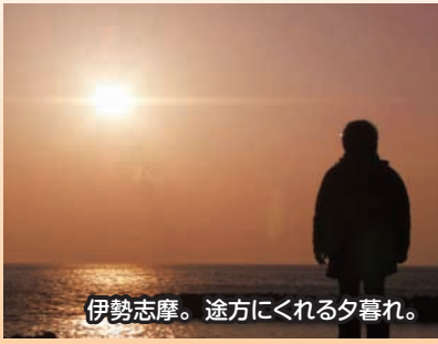
伊勢志摩。途方にくれる夕暮れ。

こんな旅や日常の四方山話の連載です。楽しんで頂けたら光栄です。ご愛読お願い申し上げます。——つづく