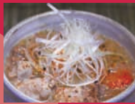
串揚げともつ煮 上田屋 「上田屋のもつ煮 二日目」