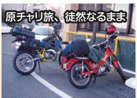
【原チャリ弥次喜多珍道中】

この度、さぎプレご好評ということで、この記事ページが増えました。これもご愛読者の皆様のおかげです。感謝申し上げます。さて、増量に伴いこの旅行記が私の持ち分に…。しかし、これといったネタになる旅行も無く、今回は今年のお正月まで遡らせていただきます。