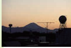
M.Hさん 台風18号の後の鷺宮から見た富士山です。