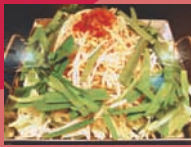
ほるもん善 「鉄板鍋」