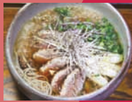
手打ち蕎麦 太鼓屋 「みぞれ鴨 コシヨウ南蛮」