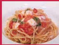
クチーナ ジオジオ Cucina Gio Gio 「タラコのケッカ風スパゲティー」