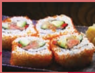
江戸や鮨八 「サギノミヤロール」