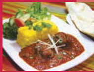
アジア料理 Lama 「トマトとビーフのスパイスカレー」