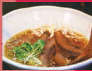
らーめん麺々 「タン・チャーシュー麺」