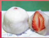
自家製和菓子の大和屋 「いちご大福」