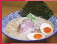
らーめん秋龍 「とんかつ醤油 たまごらーめん」