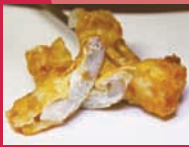
串揚げ料理 揚派 「帆立の湯葉巻き」