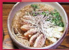
手打ち蕎麦 太鼓屋 (map G-6) 「みぞれ鴨コショウ南蛮」 是非、ご賞味ください!!

総応募が350店を超える中、鷺宮商明会から「手打ち蕎麦太鼓屋」(みぞれ鴨コショウ南蛮)が見事に、1次審査通過の19品目に残りました。応援していただいた皆様、本当にありがとうございました!!