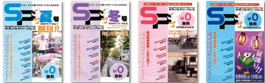
第1号 2007年4月 第2号 2007年11月 第3号 2008年4月 第4号 2008年7月

鷺宮商工会が発行するフリーペーパー「さぎブレ」。地元商店街の店舗紹介と地域の皆さまとの接点をより増やそうと年3回10,000部づつ発行し、10号までたどり着くことができました。今後もより楽しんで頂ける誌面作りに努力していきますのでぜひ、これからもお手にとってご覧頂きますようお願い申し上げます。