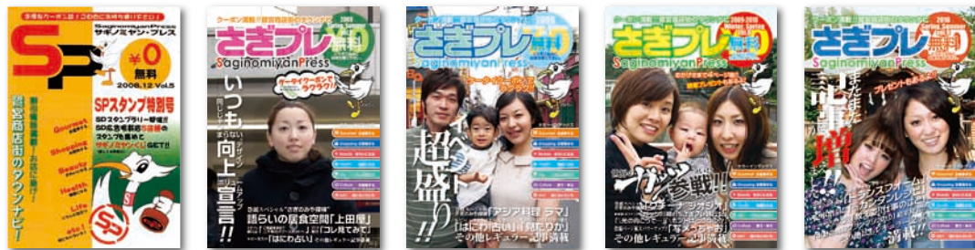
第5号 2008年12月 第6号 2009年4月 第7号 2009年7月 第8号 2009年12月 第9号 2010年4月