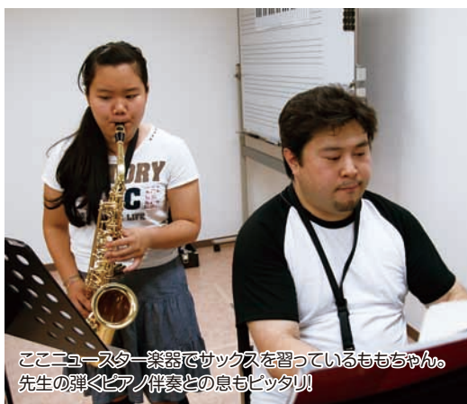
ここニュースター楽器でサックスを習っているももちゃん。先生の弾くピアノ伴奏との息もピッタリ!

習える楽器はピアノ、エレクトーン、トランペット、サキソフォン、フルート、クラリネット、バイオリン、ビオラ、チェロ、ギター、ウクレレ、オカリナと多数。各楽器の経験豊富な講師が在籍し、初心者から上級者まで生徒のレベルや目的に合わせてマンツーマンでわかりやすく、丁寧に教えてくれる。また、どの楽器も無料体験レッスンが受けられ、楽器は触ったことも無いとい