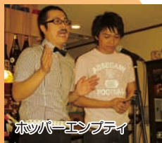
ホッパーエンブティ