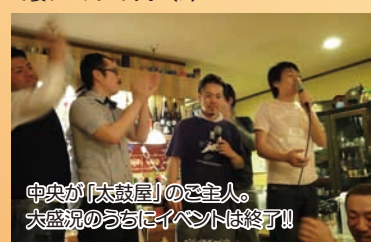
中央が「太鼓屋」のご主人。大盛況のうちにイベントは終了!