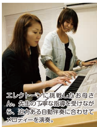
エレクトーンに挑戦したお母さん。先生の丁寧な指導を受けながら、迫力ある自動伴奏に合わせてメロディーを演奏。

う方や、続けられるか不安という方も安心してチャレンジできる。個人レッスンなので自分の空き時間やライフスタイルに合わせ、無理なくマイペースで通えるところも魅力だ。「楽器をはじめたい!」「素敵な音楽に囲まれてみたい!」そんな風に思ったら是非一度、ニュースター楽器の無料体験レッスンで音楽の素晴らしさに触れてみては?