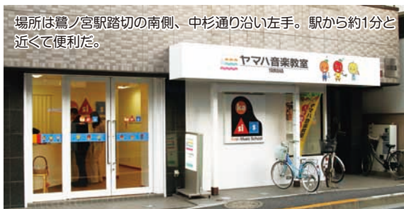
場所は鷲ノ宮駅踏切の南側、中杉通り沿い左手。駅から約1分と近くて便利だ。

ニュースター楽器は、楽器を上手に演奏することはもちろん、生徒が「幸せな演奏家」になるサポートをしてくれる素敵な音楽教室だ。