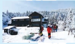
山小屋です。山頂まであと一步。

『ピラタス蓼科ロープウェイ』を使えば、山頂駅から1時間ほど。冬期はある程度の防寒とアイゼン、スノーシューなどの装備で、