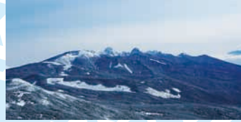
遠くに、続く八ヶ岳の連なりが見えます。北横岳は八ヶ岳の北から二つ目の山です。

山頂からの景色、特に冬の雪景色は素晴らしい、この手軽さでこの眺望を我が物にできるという意味で、お勧めの山です。