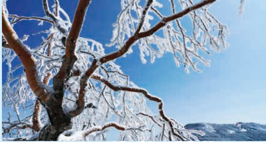
場所は信州。北八ヶ岳の『北横岳』標高 2,480 メートル。

このほどバイク旅ばかり続きましたので、ちょっと趣向を変えて。毎日暑い日々をお過ごしの皆様に、東の間の涼しさを感じていただけたらと思い、雪山写真日記です。