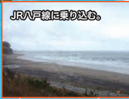
JR八戸線に乗り込む。