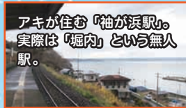
アキが住む「袖が浜駅」。実際は「堀内」という無人駅。