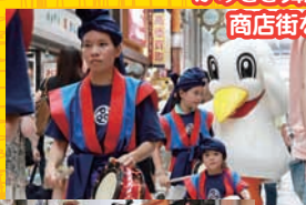
かみさぎ舞鼓打人と共に 商店街を練り歩く