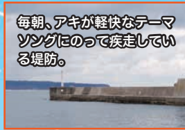
毎朝、アキが軽快なテーマソングにのって疾走している堤防。