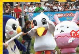
もちろんセンター!!