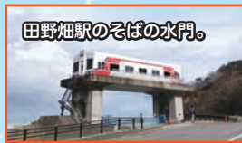
田野畑駅のそばの水門。

道」略して「北鉄」というネーミングですね。翌日は天気が回復。軽快にバイクの旅再開です。劇中の「袖が浜」の観光海女センター。海女さんたちがウニを獲って観光客に食べさせるあの場所です。実際も「北限の海女、海女センター」という観光スポットになっています。ウニ獲りの実演はさすがに季節ではなく、行ってませんでした。