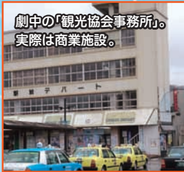
劇中の「観光協会事務所」 実際は商業施設。