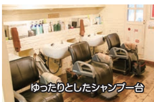
ゆったりとしたシャンプー台