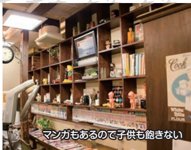
マンガもあるので子供も飽きない