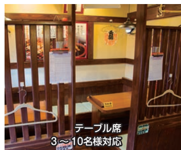
テーブル席 3〜10名様対応