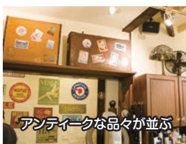
アンティークな品々が並ぶ