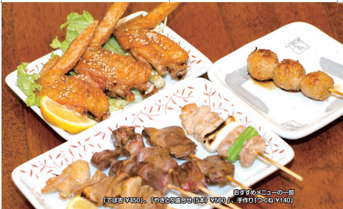
おすすめメニューの一部 「てば吉 ¥450」、「やきとり盛合せ(5本) ¥560」、手作り「つくね ¥140」