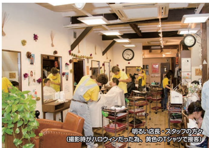
明るい店長・スタッフの方々 (撮影時がハロウィンだった為、黄色のTシャツで接客)