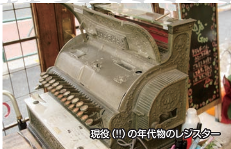
現役 (!! ) の年代物のレジスター