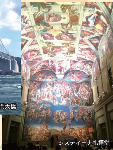
システイーナ礼拝堂

とある団体のミッションの合間をぬって、まず訪れたのが栗林(りつりん)公園。元は香川高松十二万石、水戸徳川家の松平家(暴れん坊将軍!)が5代、100年かけて造営した高松藩別邸。この庭園を1時間ほどの散策。