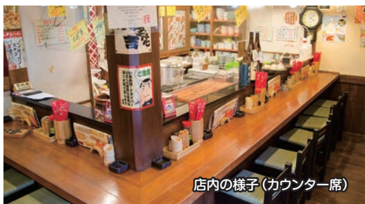
店内の様子(カウンター席)