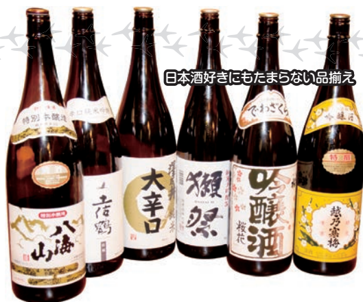
日本酒好きにもたまらない品揃え