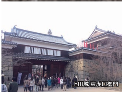
上田城 東虎口櫓門

上杉景勝に対抗するため真田正幸が徳川家康に費用を負担してもらって築いたのだけれども、その後、家康を裏切ったため、2度にわたって攻められるも落城しなかったというから皮肉ですね。テレビでの草刈正雄のしたたかなり顔が思い出されます。写真は東虎口櫓門。