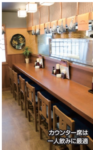
カウンター席は 一人飲みに最適