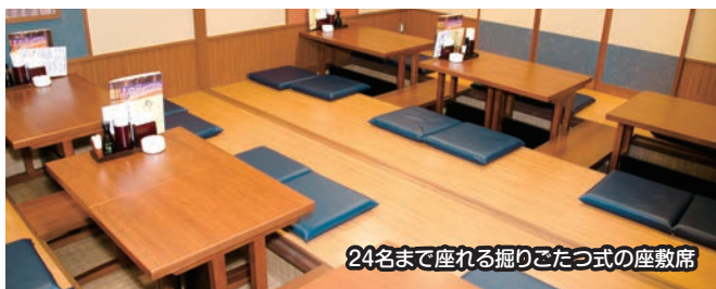
24名まで座れる掘りごたつ式の座敷席