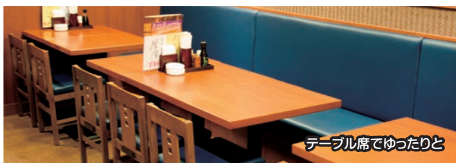
テーブル席でゆったりと